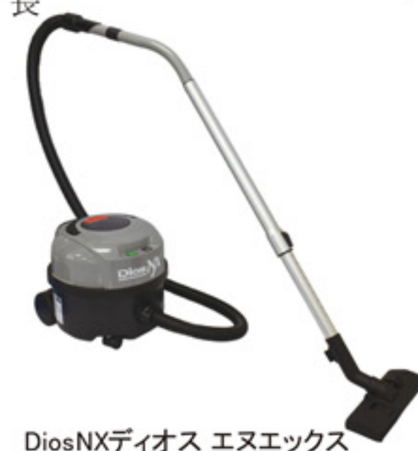
DiosNXディオス エヌエックス

ありません。人感センサー搭載の為、人の入室を感知し作動し始め、退室後約10分で自動的にOFFになりますので無駄な電力消費を抑えることが出来ます。本体サイズh657×w125×d60(mm) 騒音レベル54dB消費電力2.6W 狭い個室内でも気にならないサイズです。共有トイレのある、病院や介護施設、食品工場や飲食店、学校をはじめ幼稚園などにご提案できます、特に蓋の無いトイレなど設置されている現場に最適です。近日発売予定、気になった方、詳しい説明を聞きたいという方は弊社営業担当までお願いします。