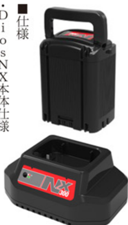
NS300 バッテリー&充電器

・1時間で80%、2時間で100%充電完了。急速充電で繰り返しの使用も可能にします。