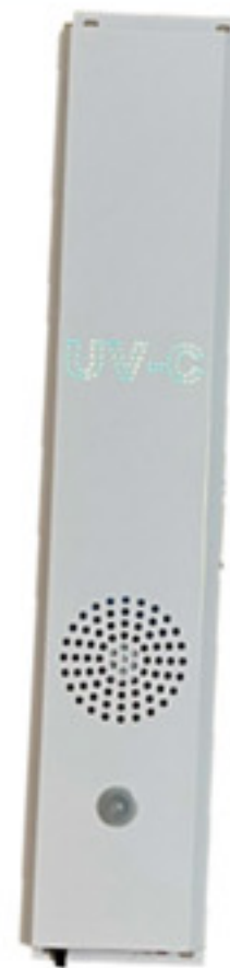
トイレットブルームバスターII

トイレで水を流した時に巻き上がるウイルスや菌を含んだエアロゾルを上部より吸い込み、UV-C (波長254nm・紫外線強度8,000μw/cm 2 )の殺菌灯でウイルスを不活性化、菌を除菌して下部より排出します。また周辺の手摺やスイッチ、便座やドアノブに至るまで人の触れる可能性のあるところはオゾン力で除菌することが出来ます。直接紫外線を照射するのではなく、個室内の空気をファンにより循環させ、本体内部の近距離にて紫外線を照射することにより、より強力な除菌効果を得られ、紫外線による人体への影響にも配慮された設計となっております。同時に発生させるオゾンも13mg/hの低濃度なのでウイルスや菌には効果があり、人体などへの影響は与えず、残留物も