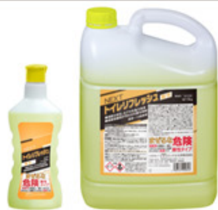
NEXT トイレリフレッシュ 酸性 800g / 5kg

『NEXT トイレリフレッシュ 酸性』 従来のセラミッククリーナー同様、水面下の汚れにも対応できるような適度な粘性を持たせています。塩酸系の酸性トイレクリーナーですが、表面保護剤を配合しているため、素材を痛めにくく、単分子皮膜を形成することで汚れの付着および配管の腐食を抑制します。