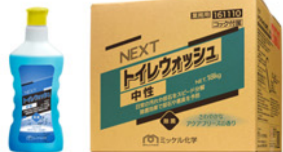
NEXT トイレウォッシュ 中性 800g / 18kg

ます。泡切れも良く作業性も抜群です。気になる香りですが、・・・従来品と同じ香料を使用しています。アクアブリーズの香りと題しておりますが、従来のラムネのような清涼感のある香りを継承しています。