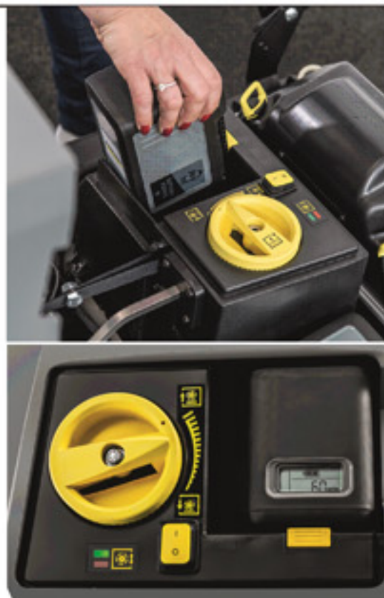
ブラシ圧力調整&バッテリー残量パネル

新たにラインナップに加わりました、弊社のカーペットスワイパー「CVS65/1Bp」6つのメリットをお伝えします。